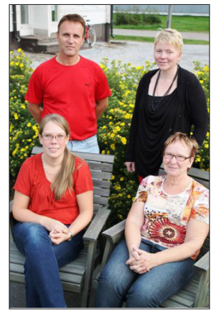
Projektgruppen i augusti 2012

I samband med utbetalningsansökningarna har fyra mellanrapporter tagits fram inom projektgruppen och lämnats in till Aktion Österbotten och ELY-centralen.